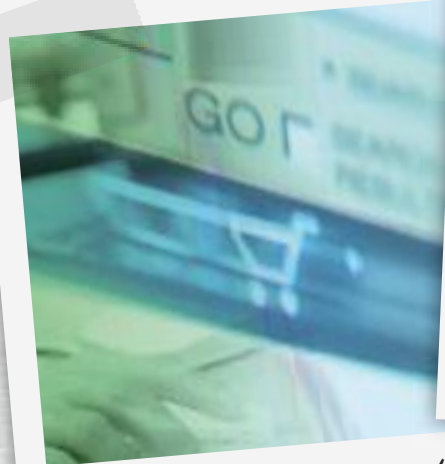
slimme geldtips voor scholieren op: www.nibudjong.nl

Zoek uit of er mogelijkheden zijn voor extra inkomsten. Dat is sowieso aan te raden als uw overzicht een tekort laat zien. Kijk op www.berekenuwrecht.nl voor informatie over subsidies en toeslagen. Of informeer naar het minimabeleid van uw gemeente. Tot slot behoort een (beter betaalde) baan misschien tot de mogelijkheden.