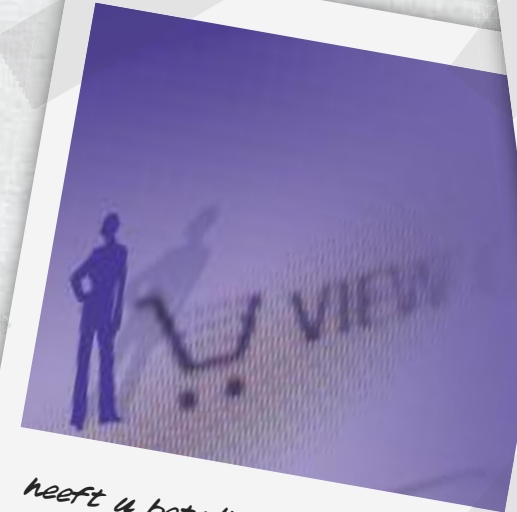
heeft u betalingsproblemen?

Bij een tekort kunt u ook uw uitgaven eens kritisch onder de loep nemen. Het Persoonlijk Budgetadvies laat zien of u aan bepaalde posten meer besteedt dan huishoudens in vergelijkbare omstandigheden als u. Kies een paar posten uit waarop u probeert te bezuinigen. Hoe u dat aanpakt, leest u op www.nibud.nl/bespaarplan . Op www.nibud.nl vindt u heel veel slimme geldtips.